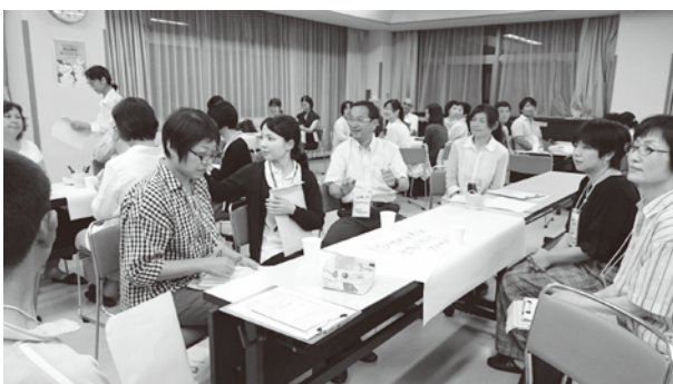
写真 d 会場のひとこま