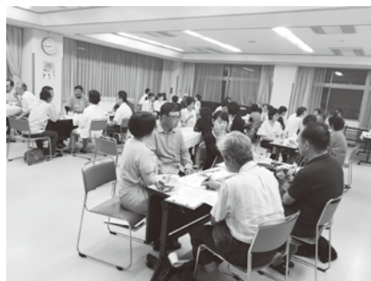
写真 b 第二部の全景